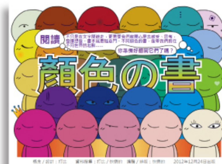
香港閱讀城青年書館 www.hkreadingcity.net/library