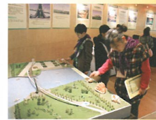
行程第3站：佛山城市規劃展覽館。