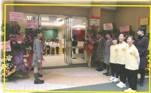
小導遊及童軍列隊等候嘉賓進場。