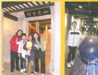
規劃展覽館內的仿古建築物前合照。