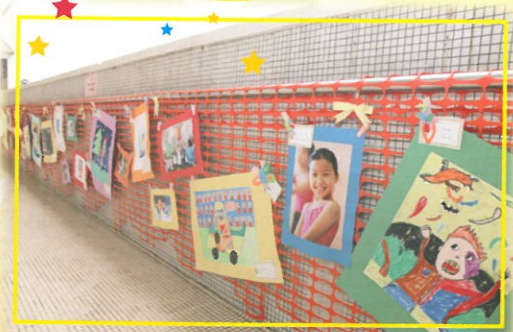
學校的走廊搖身一變成為畫廊。

本校由去年五月開始全面翻新校舍工程，至九月搬遷及開課，再於十二月舉行開幕典禮，全體教師及員工在短短半年間面對種種挑戰，都能一一克服，衝破重重障礙，使學校能在穩固的基石上邁步向前，在這一片肥沃的土地開出更燦爛的花朵。