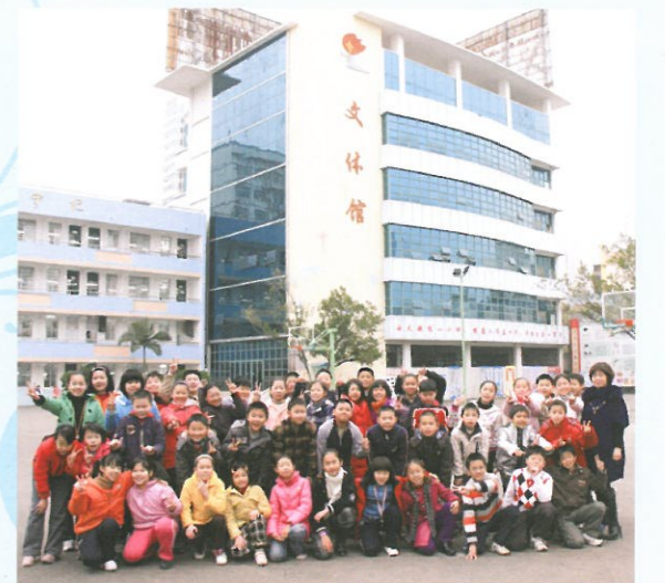
內地寫作交流同學（廣西南寧市星湖小學）

本年度學校繼續參與「內地與香港教師交流及協作計劃」，除了透過交流與協作，繼續推行普教中課程及推廣普通話風氣外，我們還嘗試於6C班推行兩地學生寫作交流活動，與廣西南寧市星湖小學協作，為兩地學生搭建寫作交流的平台；期望透過「同題寫作、同輩互評、心得分享」等活動，提升學生運用書面文字表達所想所聞的能力及興趣，增加兩地同學的溝通機會。