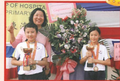
得獎同學與校長合照。