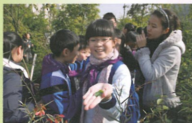
在藥廠的「百草園」參觀，同學對藥草都很有趣。