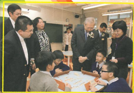
孫局長對數學遊戲「魔力橋」甚感興趣。