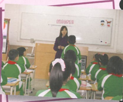
同學們均用心上數學課呢！

本年度學校繼續參與「內地與香港教師交流及協作計劃」，除了透過交流與協作，繼續推行普教中課程及推廣普通話風氣外，我們還嘗試於6C班推行兩地學生寫作交流活動，與廣西南寧市星湖小學協作，為兩地學生搭建寫作交流的平台；期望透過「同題寫作、同輩互評、心得分享」等活動，提升學生運用書面文字表達所想所聞的能力及興趣，增加兩地同學的溝通機會。