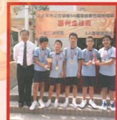
男子隊奪得小學三人籃球賽冠軍。