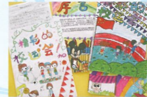
第二次主題寫作的作品——「東亞運動會」