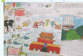
第一次主題寫作的作品——「國慶60年」