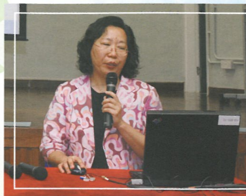
校長在大會上的分享。