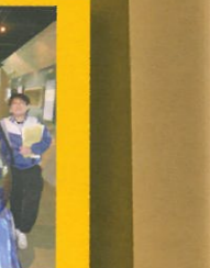
祖國的新科技發展，令同學大感興趣。