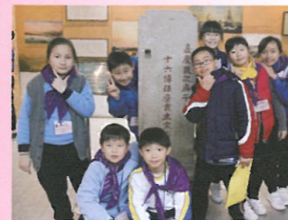
開開心心地在古港博物館內合照。