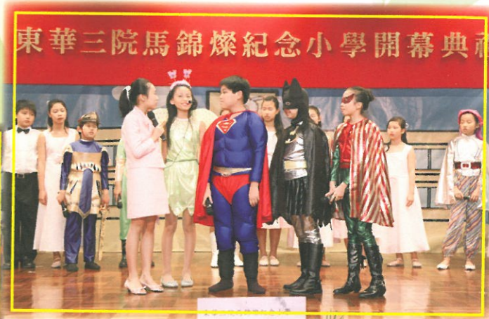
小演員以流利的英語又唱又做，嘉賓們都讚口不絕。