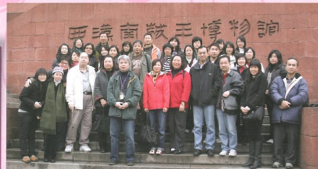
東華三院小學的校長、老師們齊齊參觀南越王墓。