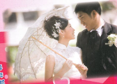
楊永亮老師結婚了。

謝sir大學畢業了！人是要終身學習的，無論是甚麼年紀，總之有需要的時間，都要增值自己。