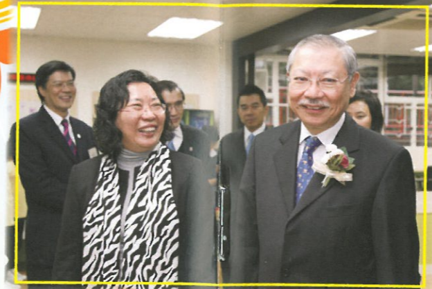
馮校長向主禮嘉賓孫明揚局長介紹本校新設施。