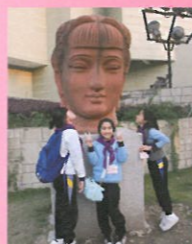
黃昏時，在廣東美術館前欣賞藝術品。