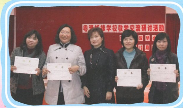
馮校長與本校老師到廣州參加「東華三院聯校教師專業評課學習團」。