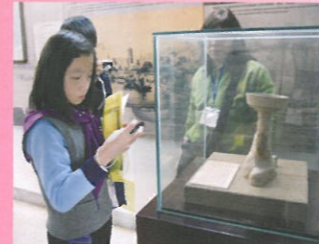
古港博物館內有不少珍貴的文物。