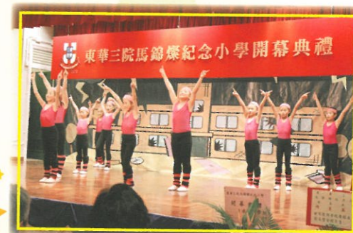
舞蹈組同學隨著節拍強勁的音樂起舞，會場一下子變得熱鬧起來。