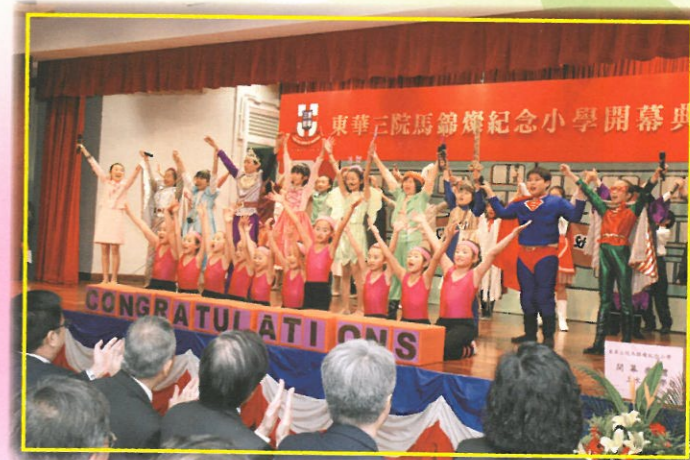
同學們以音樂劇恭賀本校開幕，表演結束時全場掌聲雷動。