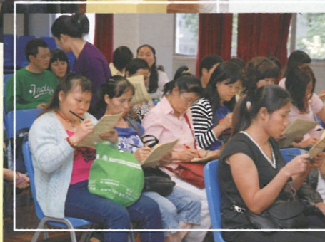
家長積極參與投票。