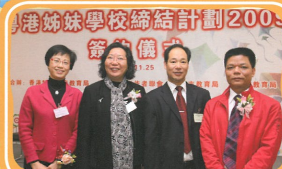
本校與深圳市坪山中心小學締結為姊妹學校，促進兩地學術交流。