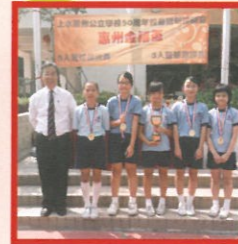
女子隊奪得小學三人籃球賽冠軍。