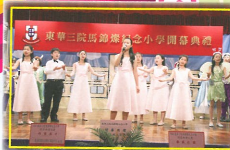
民歌隊同學投入於每個音符之中，以歌聲感染全場觀眾。