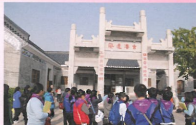
行程第2站：黃埔古港。