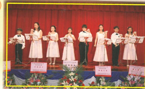
手鐘隊演奏的音樂悠揚悅耳，令全場觀眾屏息欣賞。