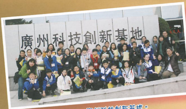
行程第1站：廣州科技創新基地。