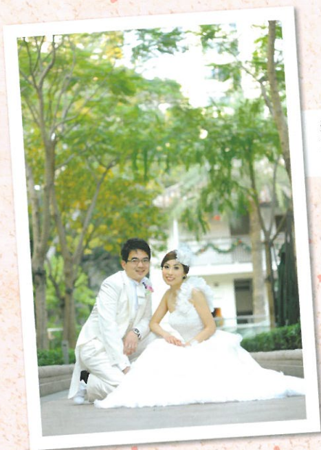
這個漂亮的新娘子 就是禰老師了！