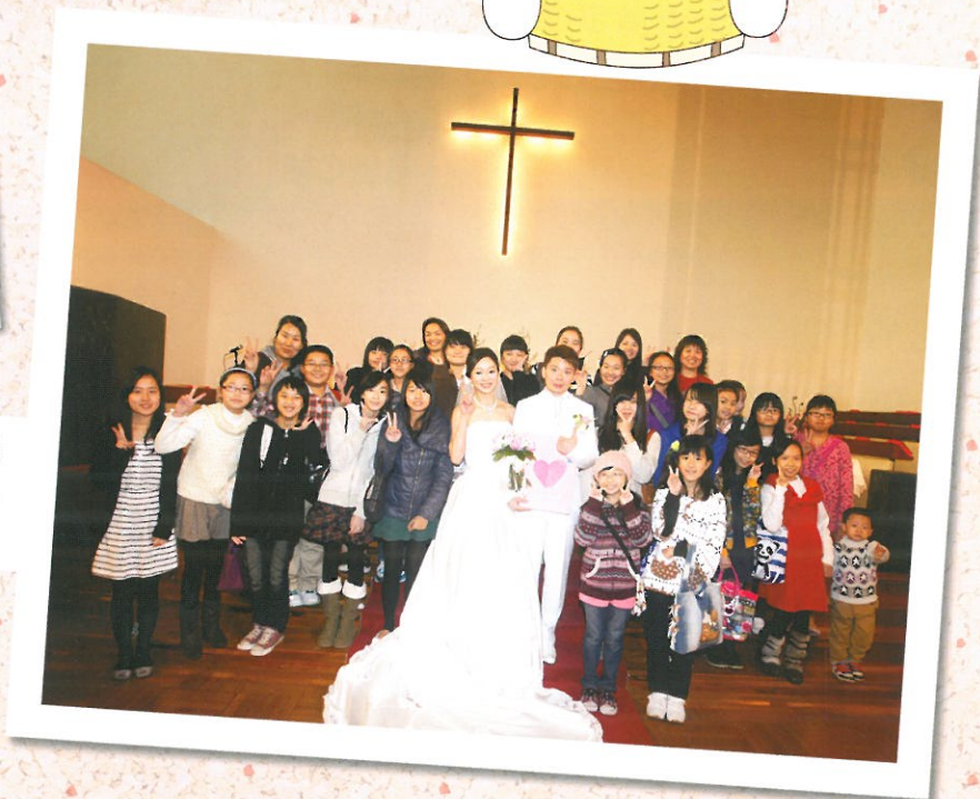
徐老師衷心感謝出席她 婚禮的同學及家長，為 她帶來更多祝福及喜悅！