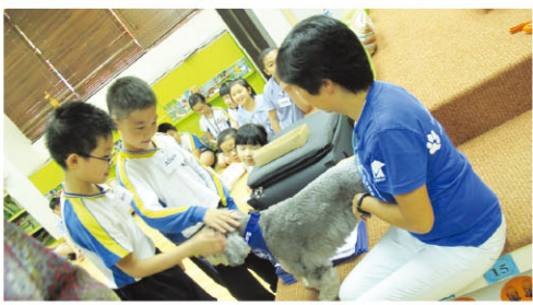
Students say hello to our dog guest.

Animal Asia Programme - Students from P.4, P.5 and P.6 learned all about dogs. They also had a chance to meet a special dog guest.