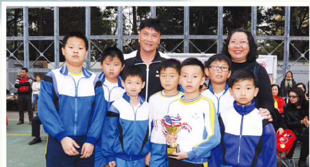
男子中級組憑著拼勁，勇奪季軍