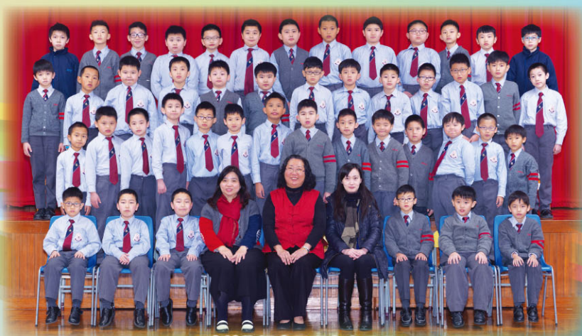
中詩集誦來一張大合照吧！

本校於第六十六屆香港學校朗誦節比賽，獲95項優良獎及5項良好獎，合共參加達100個組別的賽事，以下為得獎組別及學生名單：