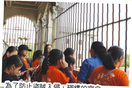
為了防止盜賊入侵，碉樓的窗戶架設防盜設施