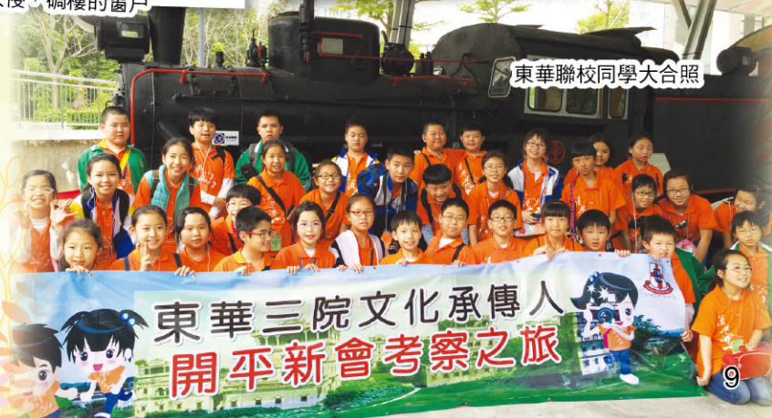
東華三院文化承傳人 開平新會考察之旅