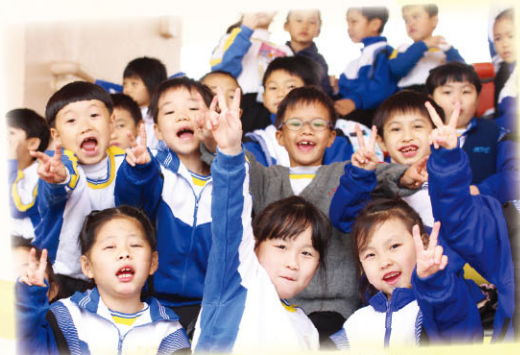
啦啦隊全力為運動員打氣