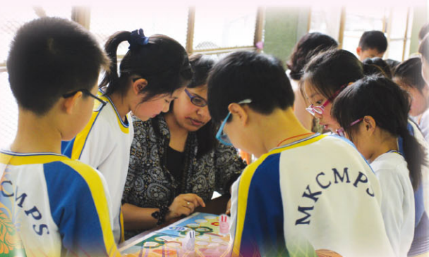
Miss M plays with P.4 students.

Students got a chance to participate in an Easter Egg Hunt and play some Easter games.