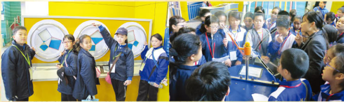
同學們在惠州科技館內動手探索 同學們留心聆聽導賞員講解科學知識

本校參加「同根同心」內地交流計劃，於2015年1月30日及31日到惠州進行交流活動。是次交流，加深學生對惠州的環保設施及自然保護區的認識，以及擴闊學生的視野。