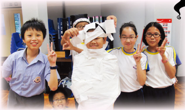
Students ward the 'Mummy'.