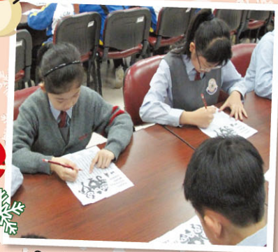
Students race to solve puzzles.