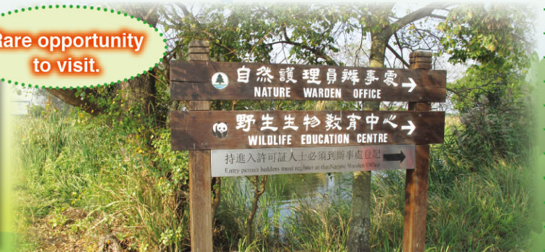
Our Students visited the wildlife education centre which helped them learn more about wildlife in the nature reserve.