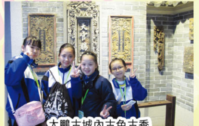
大鵬古城內古色古香