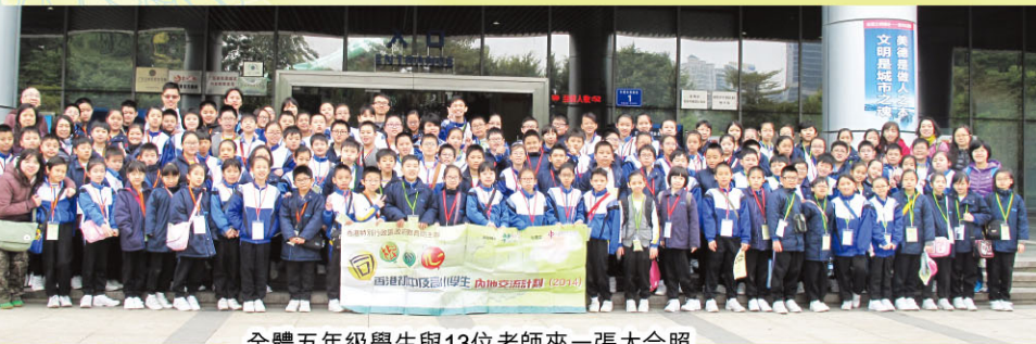
全體五年級學生與13位老師來一張大合照