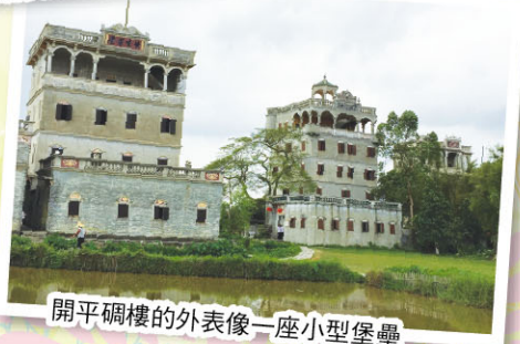
開平碉樓的外表像一座小型堡壘