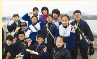
欣賞惠州西湖的風光景色