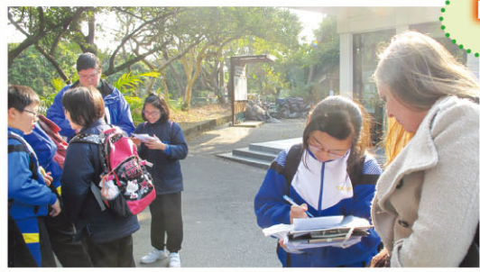
NETs help students collect information about wildlife.