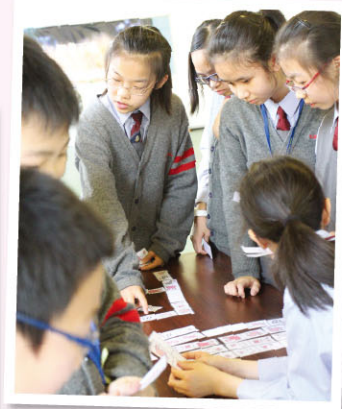
Students enjoy the Easter games.