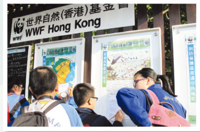
Students scan for information from the notice board.