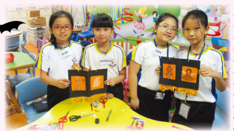
Students go 'Trick or Treating' with their friends.

Our Elite teams made Halloween decorations for the school lobby. They also had a chance to join the Halloween party. Students played games and sang chants.