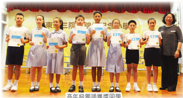
高年級獨誦獲獎同學