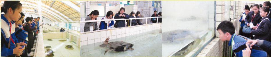
參觀惠東海龜國家級自然保護區