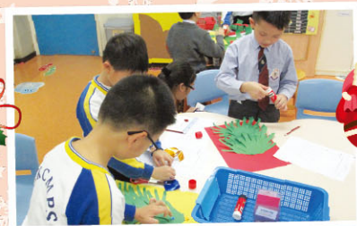
Students make Christmas trees.