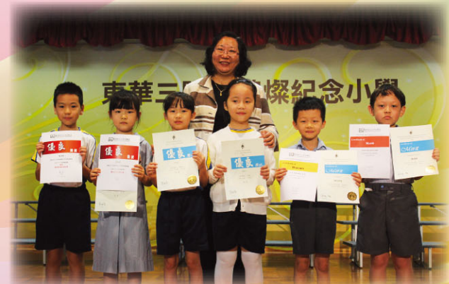
低年級的同學年紀小小已在獨誦比賽中獲獎了！