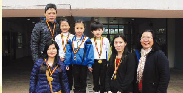
一年級親子比賽，三對親子以相同成績奪得冠軍