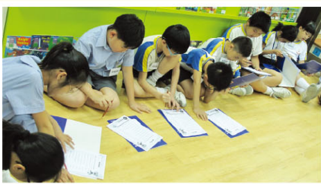
Students learn about caring for dogs.