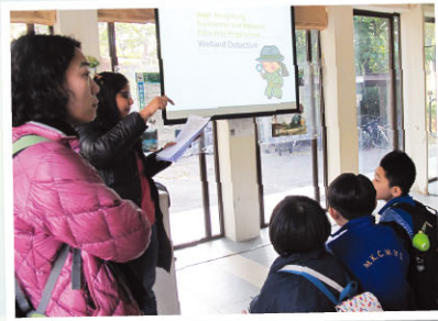
Miss.M introduces the Wetland Detective programme.