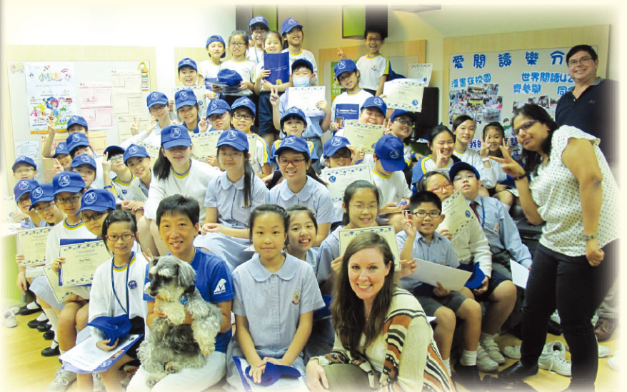
Students with their final certificates