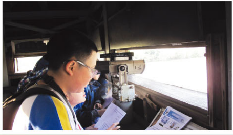
A boy tries to spot birds at the bird house.

In January, our 3 NETs and their elite teams from P.4, P.5 and P.6 went on an excursion to Mai Po Nature Reserve. They learned about birds, wildlife and their habitats. They also saw some migratory birds visiting Hong Kong.