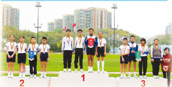
6D班榮獲4x100米冠軍及團體冠軍