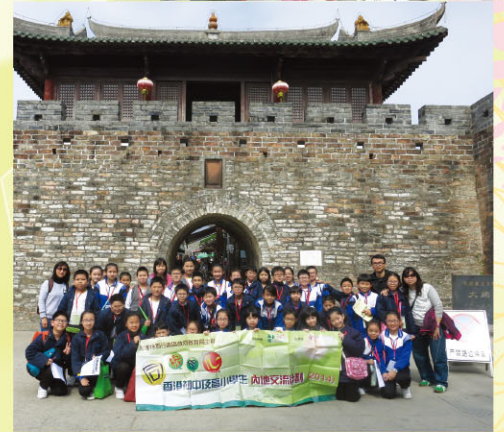
大鵬古城城下合照