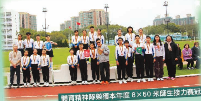
體育精神隊榮獲本年度 8x50 米師生接力賽冠軍