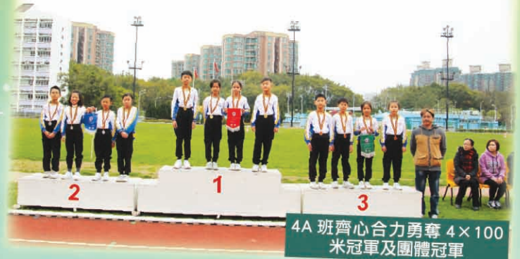
4A 班齊心合力勇奪 4x100 米冠軍及團體冠軍