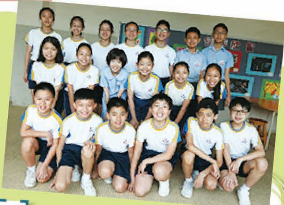
六年級奧數參賽同學