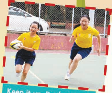
Keep it up. Don't lose it!