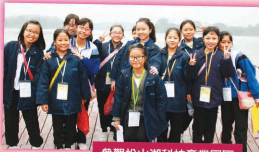
參觀松山湖科技產業園區