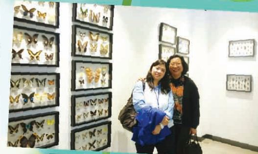
前海港灣小學的自然博物館