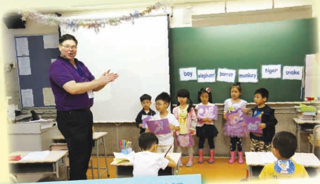
外籍老師透過有趣的活動教授學生英語，小朋友學習認真並樂在其中！