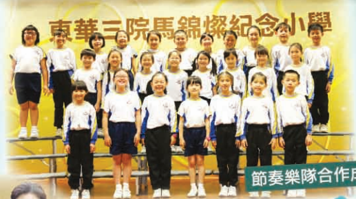
節奏樂隊合作成功!