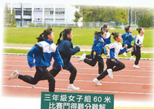
三年級女子組 60 米比賽鬥得難分難解