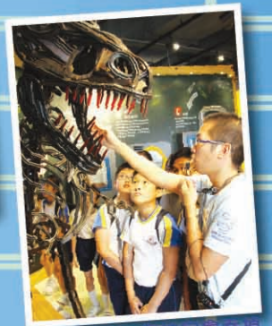
嘩，老師！你怕它會吞掉你的手嗎？