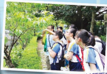
同學們難得可以靜下來，悠閒地欣賞大自然的景物。