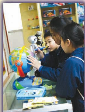
參觀東莞的港資企業