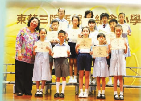
中英文班際寫作比賽