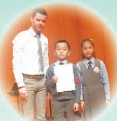
季軍得主節奏樂隊