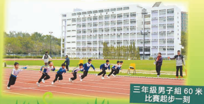
三年級男子組 60 米比賽起步一刻