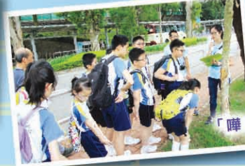
「嘩！原來大學是這麼大的！校園內竟然有車輛行駛！」