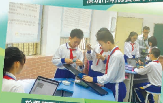
於蘆荻西小學觀常識科的實驗課