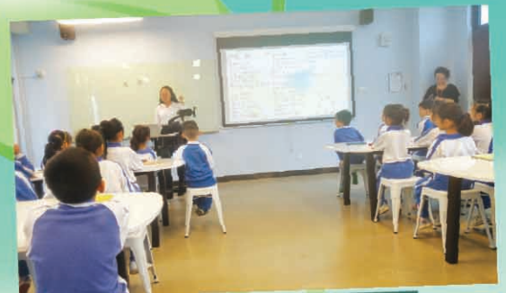
於前海港灣小學觀中文課