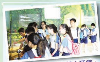
兩位同學急不及待地戴上耳筒，聽聽甚麼叫「爬樹機械人」。