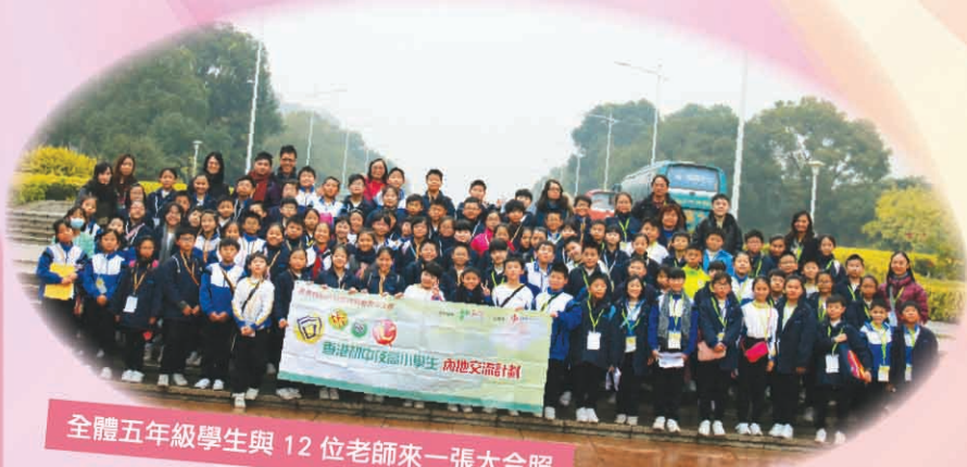
全體五年級學生與 12 位老師來一張大合照

本校參加「同根同心」內地交流計劃，於2016年1月20日及21日到東莞進行交流活動。是次交流加深學生對東莞供水工程的認識，了解東莞高科技工業及城市規劃對當地經濟及民生的影響。在過程中，同學們更學會了互相照顧、互相分享、互相包容，實在是一個不可多得的學習機會。