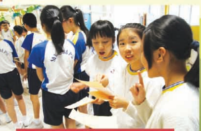
Practice makes perfect!