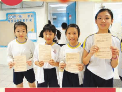
Ready with the game sheet. Are you ready? Go!