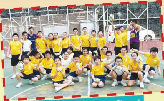
Let's take a group photo. Cheers!