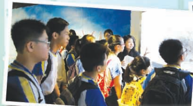
同學們細心聆聽導賞員的講解。