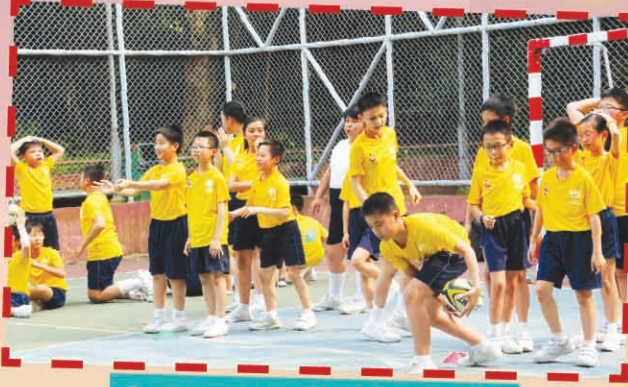
Practicing before the competition.