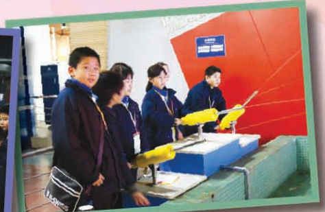
同學們在東莞科學技術博物館內動手探索