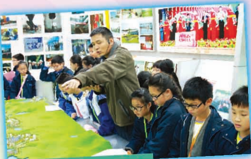
同學們留心聆聽導賞員講解有關東莞供水工程