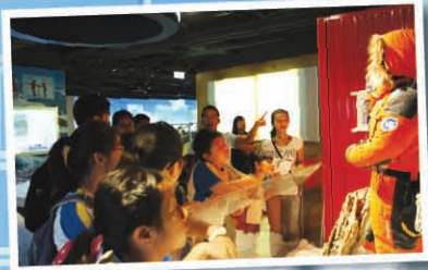
細心思量：住在冰川的人，是如何在氣候變化的環境下生存呢？