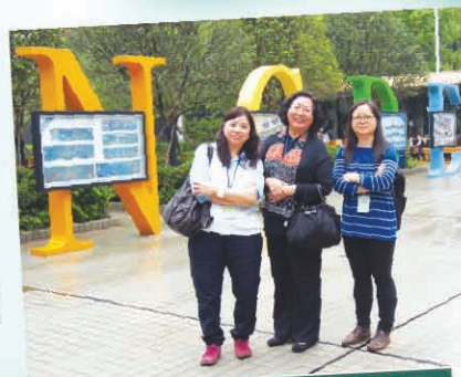
深圳市明德實驗學校操場留影