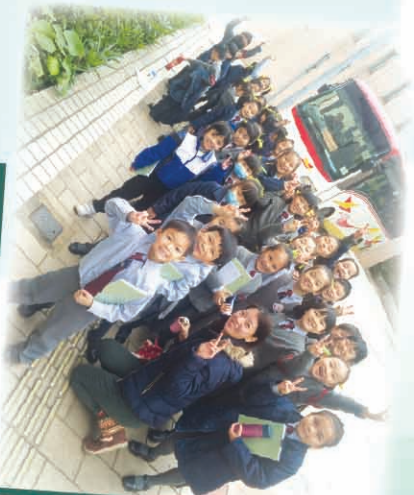
恭喜你們獲頒東華三院最佳合唱成績獎