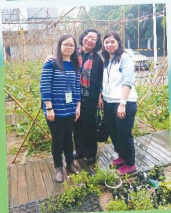
明德實驗學校的園圃