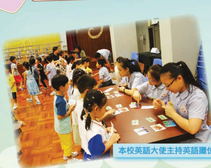
本校英語大使主持英語攤位，小朋友玩得十分投入！