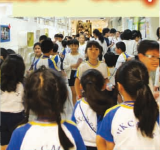
Many students were looking forward to facing the challenge!