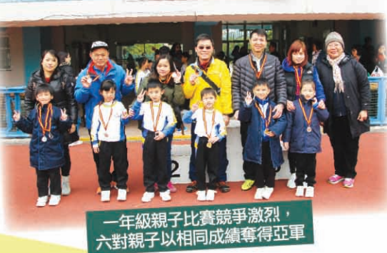
一年級親子比賽競爭激烈，六對親子以相同成績奪得亞軍