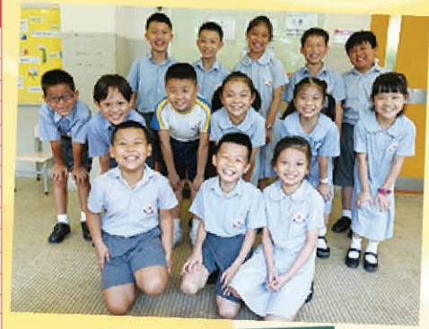
三年級奧數參賽同學