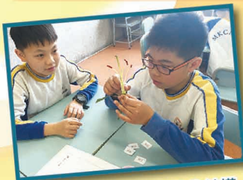
常識科探究活動 — 花的結構

強化科學、科技和數學教育，是 2015 年施政報告中的一項發展重點。在校內，本科設計了校本科探課程，透過探索為本的學習模式，讓學生手腦並用，培養他們對科探的興趣及發展科探的技能。