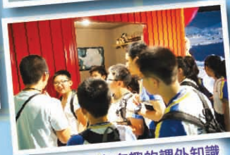
同學對眾多有趣的課外知識感到很雀躍。