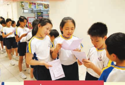
Let's practice more!