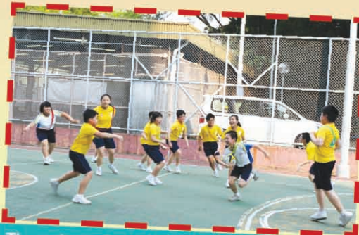
The enjoyment can be shown on their faces.