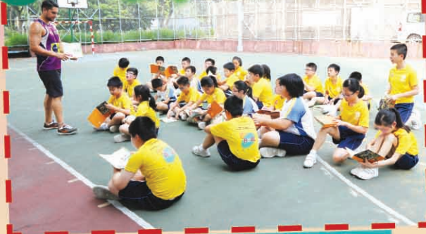
Getting to know the rules before the game.