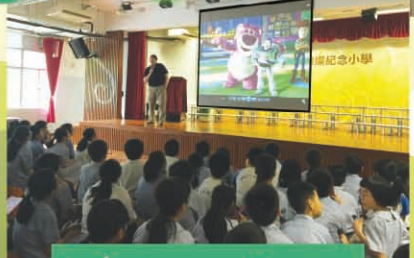
Let's share our blessings and sing together!

It's our precious chance to show our gratitude to our best friends, classmates and teachers!