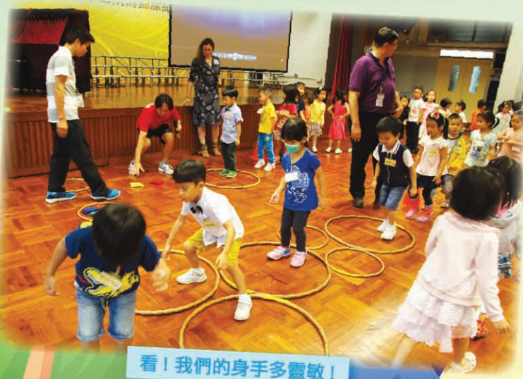
看！我們的身手多靈敏！