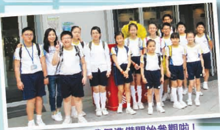
Get Set Go! 我們準備開始參觀啦！