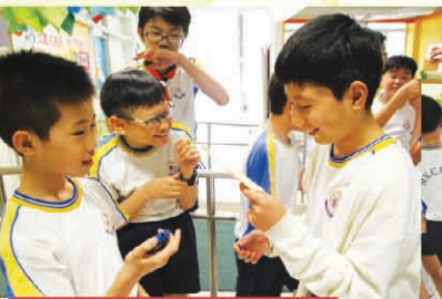
It's my turn to take the challenge!