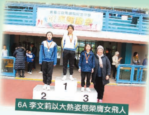
6A 李文莉以大熱姿態榮膺女飛人