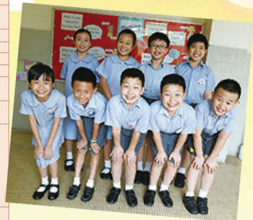
四年級奧數參賽同學