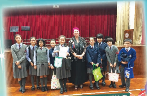
木笛小組在各位大姐姐帶領下，獲冠軍佳績

本校於第 68 屆音樂節賽事團體賽中獲 13 項優良獎及 7 項良好獎，而個人賽事中則共獲 31 項優良獎及 19 項良好獎，其中直笛小組、中文組聲樂獨唱及高音直笛三項更奪得冠軍。此外，感謝東華三院給本校頒發最佳合唱成績、最佳音樂團體成績及最佳個人樂器成績三個獎項