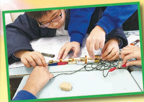
科學探究活動 — 電的探究

校外，為提升學生的興趣，發展他們跨學科應用的能力，我們積極參加與科學和科技有關的工作坊或比賽，創造機會讓學生能發揮他們創新的能力。