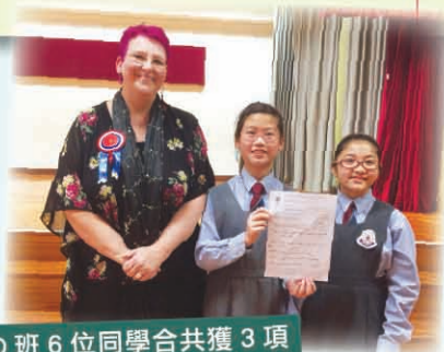
5D 班 6 位同學合共獲 3 項高音直笛二重奏季軍