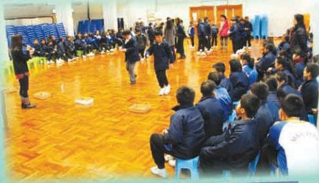
專題研習能力訓練工作坊 (P.5)