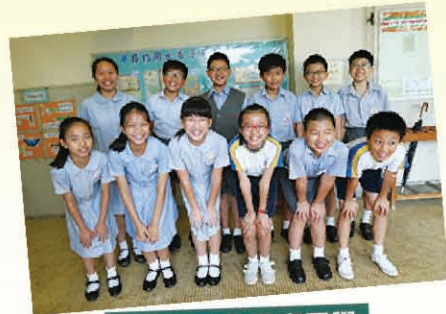
五年級奧數參賽同學