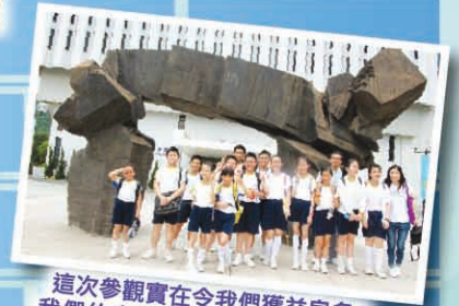
這次參觀實在令我們獲益良多！我們約定要一起努力讀書，希望將來能在大學校園內留下美好的學習回憶！