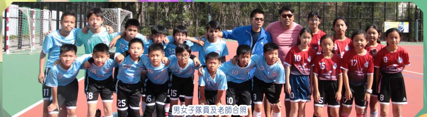
男女子隊員及老師合照