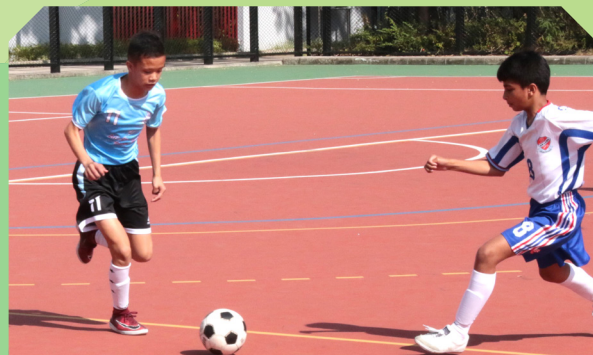
6C 麥子言球技清湛，與隊友上下一心，爭取佳績。