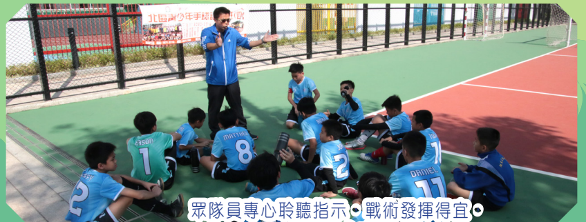
眾隊員專心聆聽指示，戰術發揮得宜，多次造成威脅。

本校男女子足球隊分別於 11 月 5 日至 12 月 20 日期間，參加北區校際小學足球比賽，兩隊隊員表現優異，男子隊獲得亞軍，女子隊勇奪冠軍。