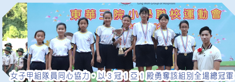
女子甲組隊員同心協力，以 3 冠 1 亞 1 殿勇奪該組別全場總冠軍

本校田徑隊於 10 月 25 日參加東華三院小學聯校運動會，勇奪女子甲組團體冠軍，並獲得 7 項冠軍、6 項亞軍、4 項季軍及 2 項殿軍。運動員表現出色，感謝家長的支持，校長的勉勵，全體老師及職工的協助。