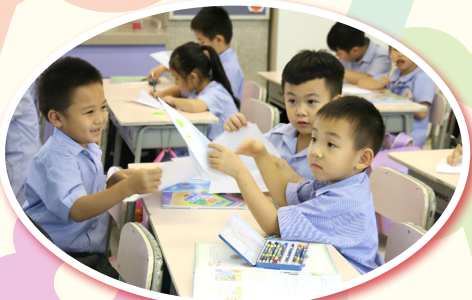
繪本閱讀《我不只是白紙》延伸創作活動