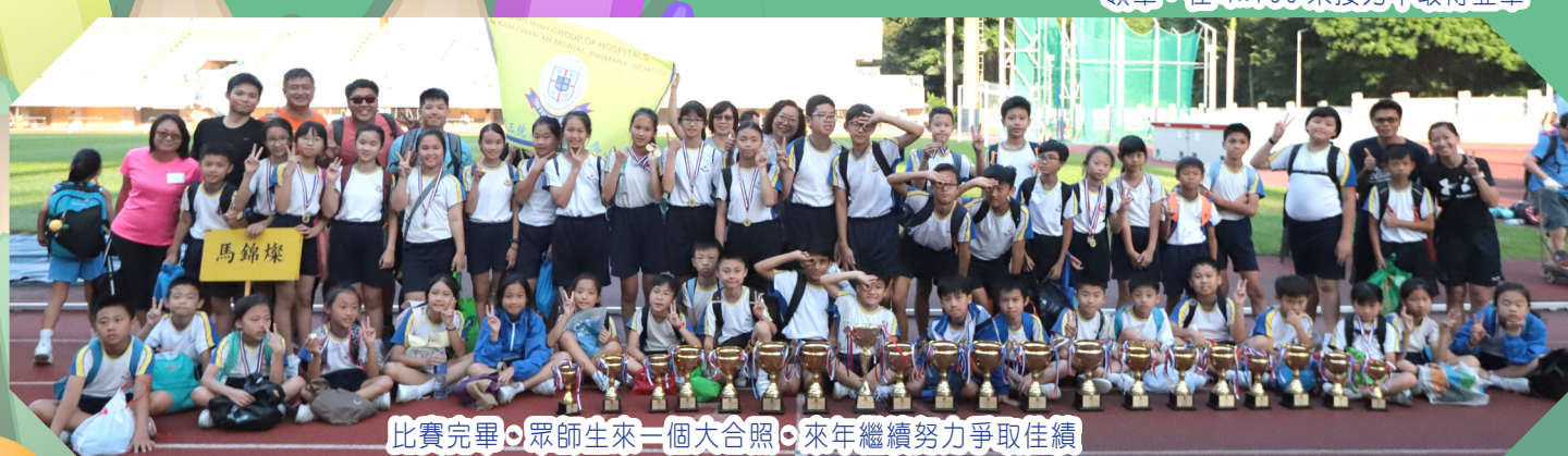
比賽完畢，眾師生來一個大合照，來年繼續努力爭取佳績