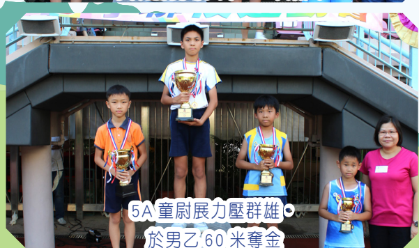
5A 童尉展力壓群雄，於男乙 60 米奪金